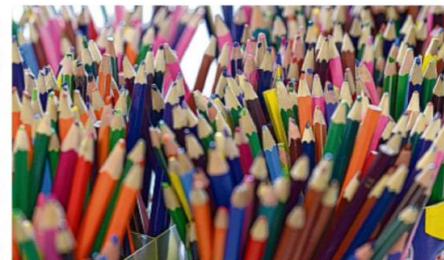
En France, l'opération "Kit Scolaire 2024" permettra de distribuer plus de 500 000 fournitures.